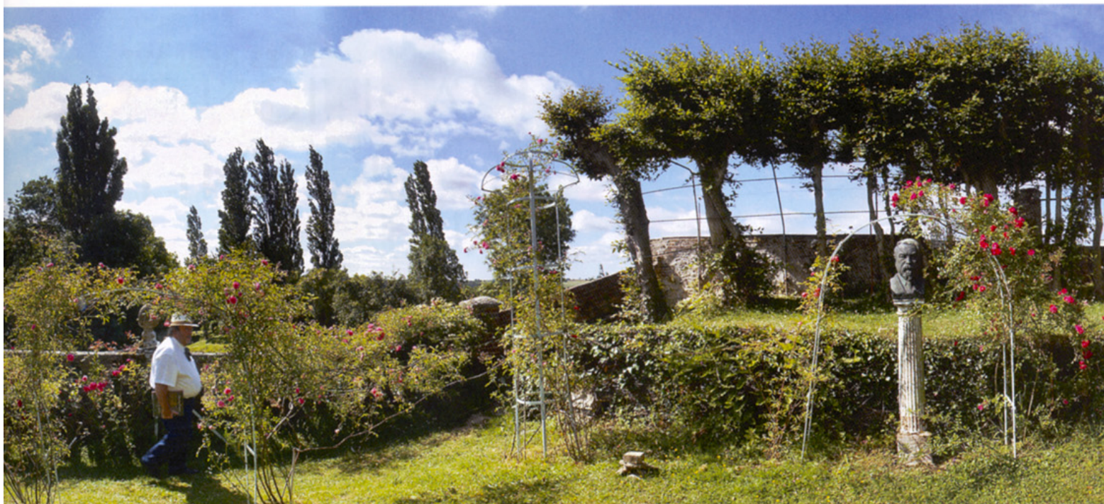
Jardin Le Sidaner à Gerberoy

dans lequel il s'installait pour réaliser ses esquisses. Plantée, entretenue et taillée par une Odile Hennebert qui vient là en amie et ne compte pas ses heures, fervente passionnée de jardins et inépuisable source de conseils et astuces, la roseraie de Gerberoy retrouve peu à peu toute sa splendeur. Avec l'aide, également, de Louis Vallois, maire honoraire du village. Les 4 000 m 2 de jardins s'ordonnent sur trois niveaux qui s'échelonnent en terrasses vers la maison. À gauche une charmille, plus loin des massifs de buis, puis une tonnelle de glycines, passage odorant vers le jardin blanc. Le très beau buste de Camille, l'épouse du peintre, nous accueille dans cet univers fleuri aux teintes pastel – hortensias, blancs, tulipes, jonquilles. Une subtile réalisation imaginée par le peintre qui souhaitait conserver l'aspect faussement sauvage de cet espace maintes fois représenté dans son œuvre. Un dernier détour par le promontoire qui surplombe la propriété, et la visite s'achève sur un sentiment d'urgence : celui d'aller admirer les œuvres de l'artiste pour y retrouver tel quel l'enchantement de ses jardins.