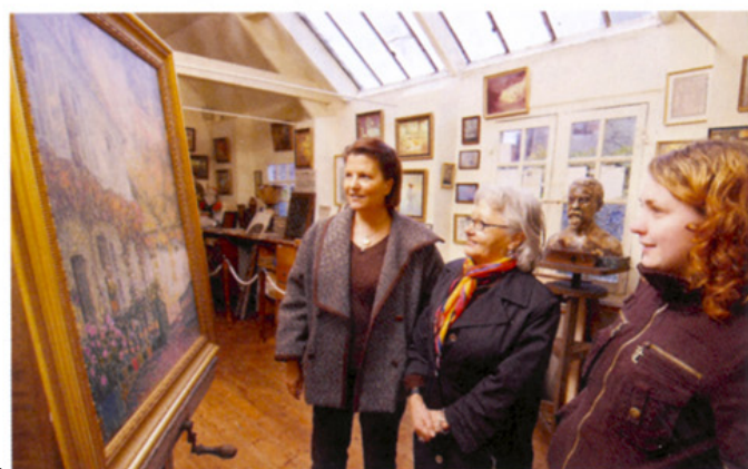
L'atelier de l'artiste